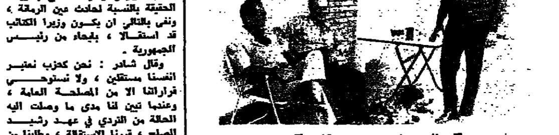
الصديق في مؤتمره «بعلبك»

هل يشي راج جابري على اي شكل حدث، لانه يتردد ان يكون يتصرف من كفة التصريح .. بنحنا نحافظ على اصحاب القاس .. وهنا وصل بعض هؤلاء ومستأجرو بعض الاراضي، فدخل في حوار معهم عن الارض والمياه، كما جاء بعض الشباب من زحلة، فالتفت بهم ومن لم عاد مع وكلاءه للتشاور على بعض المشاريع الزراعية، وكيفية لوصول مياه الري الى هذه الارضات.